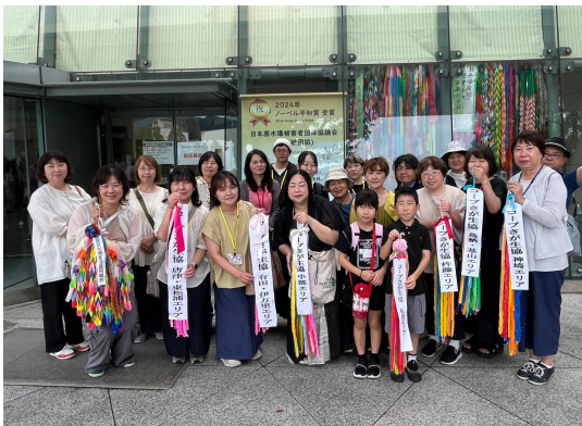
2025年 長崎原爆資料館へ寄贈してきました

この活動は、毎年、多くの組合員さんにご賛同いただき、昨年、佐賀エリアでは46名の方に2,300羽（別途 1,000羽いただきました）の折り鶴と多くのメッセージを寄せて頂きました。そして佐賀県全エリアで集まった折り鶴とメッセージを8/7(木)に開催された「ピースアクション2025 inさが」で展示後、8/9(土)に長崎原爆資料館へ皆さんの想いとともにご寄贈してきました。今年も、この折り鶴活動を通して戦災地へ思いを馳せ、戦災地の方々を忘れずに平和を願うきっかけになればと思っています。