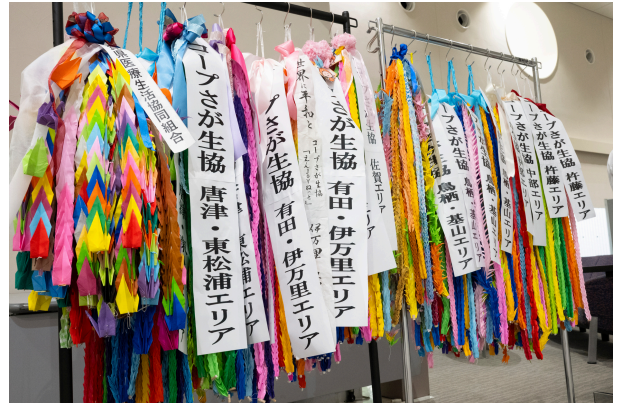
昨年の佐賀県全エリアの折鶴