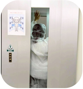
エアシャワーで 見えないホコリまで除去