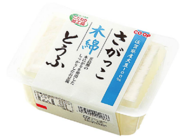
「さがっこ木綿とうふ」 しっかりとした堅さの とうふです (5月毎週企画予定)