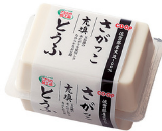
「さがっこ充填とうふ」 大豆の風味をお楽しみ頂ける なめらかな充填とうふです (5月毎週企画予定)