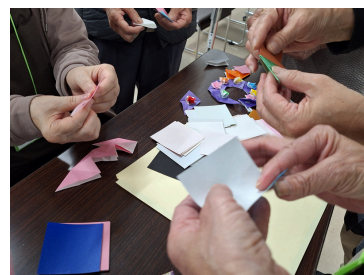
折り紙でリース作り⇒皆さん手先が器用です