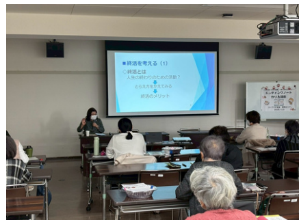
皆さん熱心にお話を聞かれていました