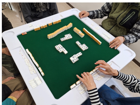
健康マージャン⇒脳を使って・手先を働かして！！

皆さん生き生き!されてました。家にじっとしていらっしゃる高年齢の方が誘いを受けて参加され、今では毎回楽しみにされている、というお話をお聞きしました。