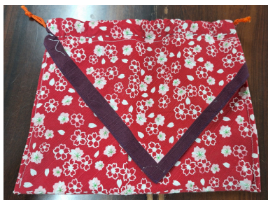
ハンカチで袋づくり⇒手縫いで綺麗にできています