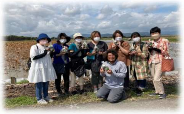
産直交流 吉田農園