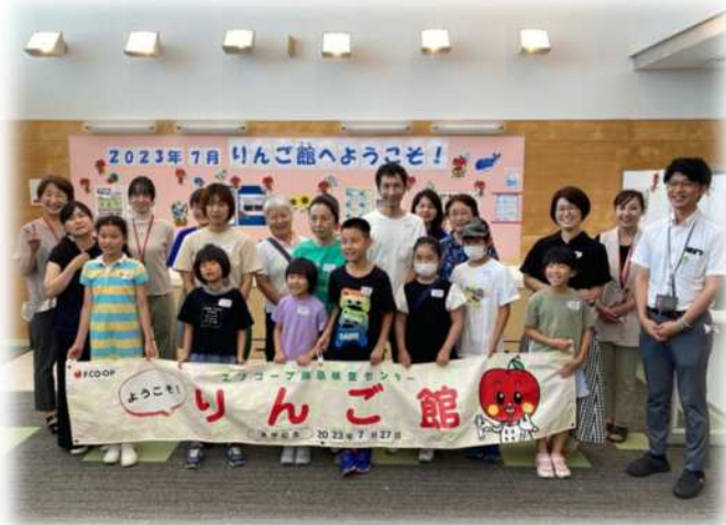
バスツアー りんご館