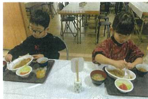
うわあ! おいしそう いただき まーす♡