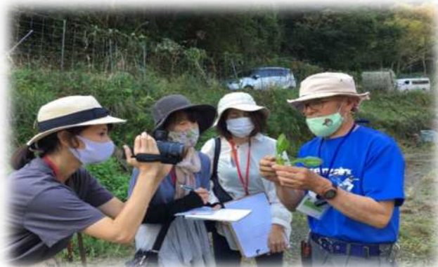
産直交流 さが育ち 水田農園