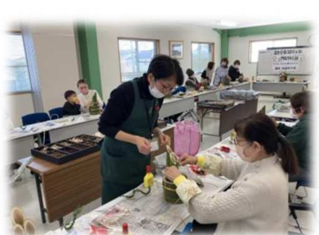
フォレストラボ 門松作り