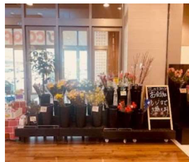
毎日入れ替わる季節の花も人気商品です