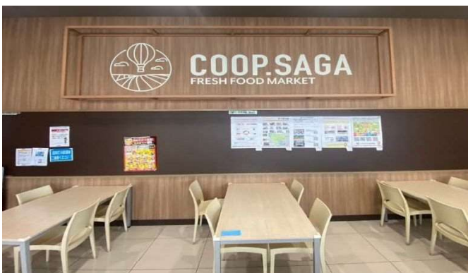
飲食しながらゆっくりできる休憩スペースが広がっていました