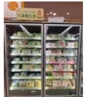
大型冷凍庫に冷凍離乳食が並んでいました

入口横に生花コーナーがあり毎日季節の花が届けられるので好評だそうです。すでに売り切れている容器もあり人気の程がうかがえました。