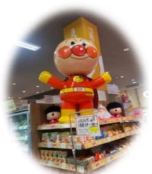
大人気のアンパンマンコーナー