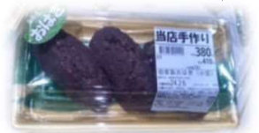
程よい甘さで美味しかったです(*^^*)

昨年11月10日にリニューアルされた店舗は、明るく広々としています(*^_^*) 陳列棚を低く通路の幅を広くしたことで視界が開き店全体が広く見えるようになったそうです。 入り口の生鮮食品から続く床と壁面が木調で統一され、落ち着いて商品を見ることができました。 導線の先にある鮮魚コーナーでは、人気のアジフライが並んでいました。 身が厚く味も良いので直ぐに売り切れるそうです。