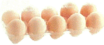
産直さくらたまご 10個 (佐賀県産) 10個 (MS~LL混)