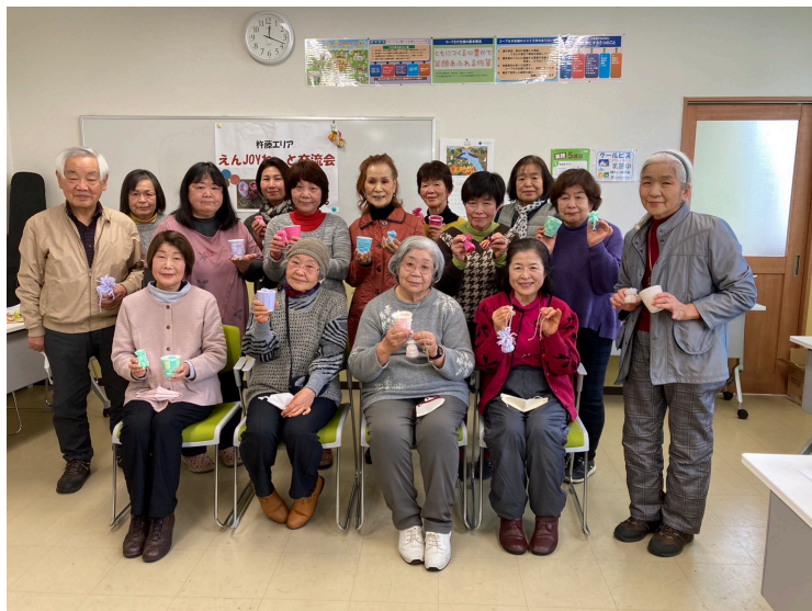
最後に作品を持って記念撮影 “ニコッと”