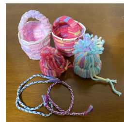
【作成した小物たち】

活動報告後は、生協のお菓子やお茶、 コーヒーをいただきながら、手芸を楽 しみました。お隣りの方々と教え合 い、他のグループの方とわきあいあい と交流ができました。