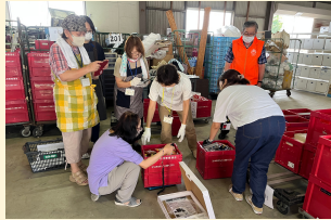
組合員のボランティアのみなんで集まった食品を仕分けしました