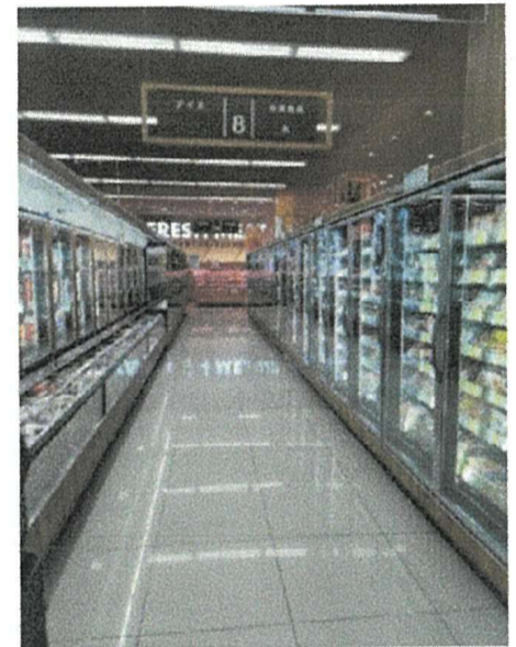
冷凍食品も充実していて、子育て応援・冷凍離乳食の棚がありました