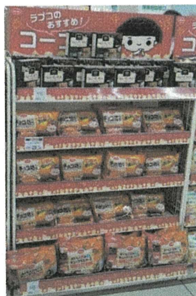
ラブコのおすすめ! (定期的にかわります)