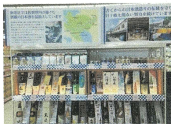
佐賀県内の酒蔵の日本酒