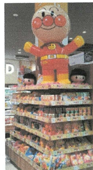
ちびっこ大好き アンパンマン