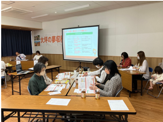
総代についてくみかつスタッフ船元&山崎が発表させて頂きました！

総代オリエンテーションとして総代・総代会の役割、2024年度第34回通常総代会までのスケジュールについても総代の皆さんと確認できました。