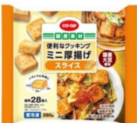
ミニ厚揚げスライス