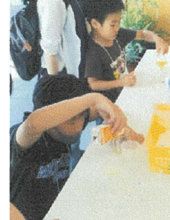
オレンジジュースを作ってみよう