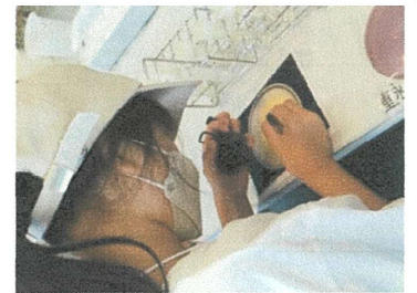
ヨーグルトの微生物を検査してみよう

※ヨーグルトの実験は、直ぐに結果が出ないため続きは自宅での観察になります。結果はどうなったでしょうか？