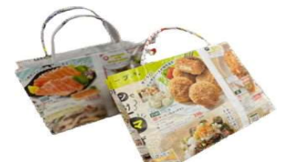
持ち帰り用の手提げ袋は 生協のカタログで手作り しました

えんJOYねっくに新しい登録グループが加わりました(*^_^*)鳥栖で活動されている「ミュージックサロン」さんです。 近々インタビュー記事を書きたいと思っていますので楽しみに！