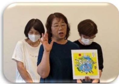
☆読み聞かせをしていただいた 本以外にも図書館にはSDGsの 書籍が沢山あります。 是非手に取ってご覧ください！