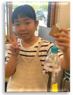
♡ 制作中、子ども達の笑顔がキラキラしていて眩しかったです(#^.^#)