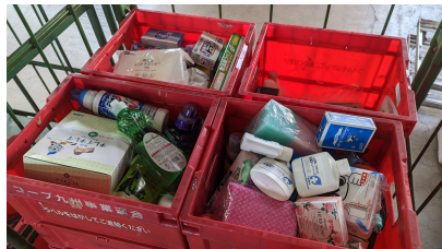
組合員のボランティアのみなで集まった食品を仕分けしました