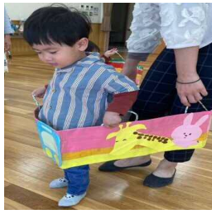
楽しい手作り電車で出発進行！