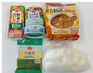
①洋風炊き込みご飯の材料