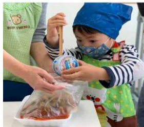
僕も材料を袋に入れて お手伝い！