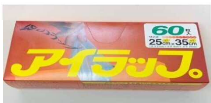
湯煎調理用ポリ袋(アイラップ) カタログ6月4週313号に掲載 (価格217円)