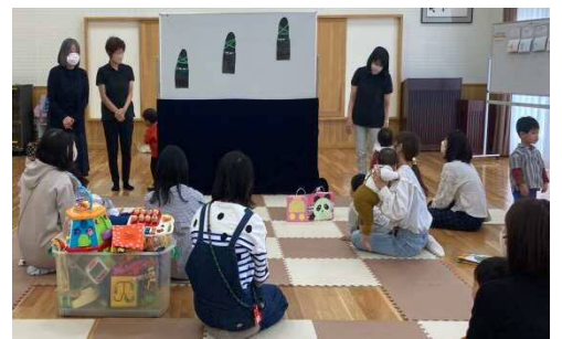
みんな静かにおはなし聞けてすごいいね！