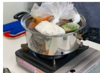
カセットガスコンロで鍋にすべての メニューの袋を入れて湯煎中