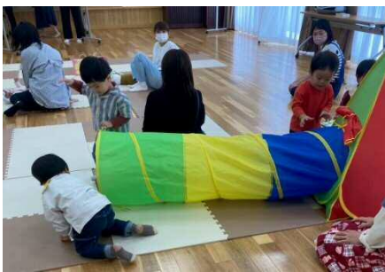
大型の遊具は、人気です！

スタッフで年度始めに参加のお子さんの手形足形を取る等して、成長を見守り優しく寄り添う心遣いやしっかりとしたチームワークでのぞまれている事が、いたるところに感じられました。会場に溢れる明るさや優しさ、そしてたくさんの笑顔がとても印象的でした！！