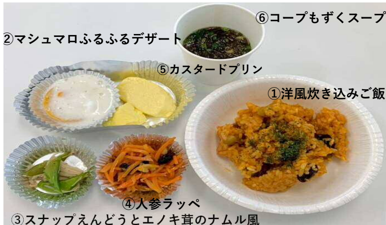
②マッシュマロふるふるデザート