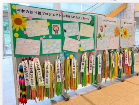
「ピースアクション2022 inさが」の様子。

今年も、この折り鶴活動を通して、戦争の記憶を次世代に継承させていくためのきっかけとなればと思っています。