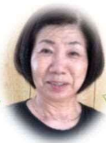
くみかつ スタッフF

障がい者雇用の皆さんが、見学されることを喜んで働いておられるとのこと、良かったなあと思いました。