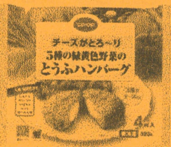
とろろハンバーグ