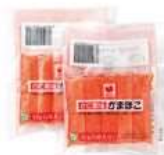
かに風味かまぼこ