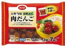
お弁当用肉だんご(甘酢あん)