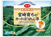
宮崎育ちのカットほうれん草