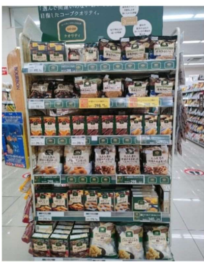
コープクオリティコーナー どれにするか迷っちゃいそうなくらい たくさん並んでいます。