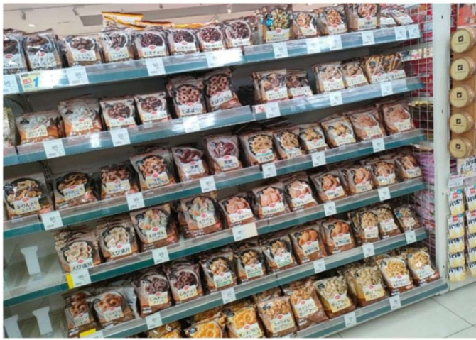
95円(税抜)コーナー 子供さんのおやつにぴったり、お財布にも 優しいお菓子がど〜んと並んでいます。