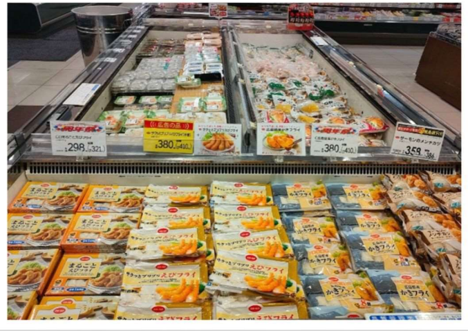
冷凍食品コーナー コープの人気商品がもずらり!並んでいました!