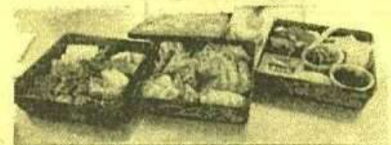
山香海のおせちと一緒に重箱に盛り付けました