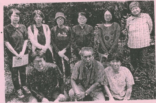
理事とくみかつスタッフで行きました。