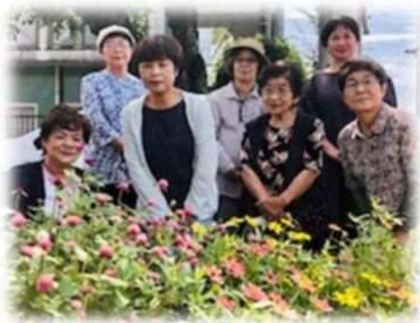
♡花々のように笑顔が素敵な“花こみち”さんでした