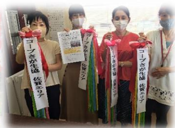
2021年 産直交流の様子