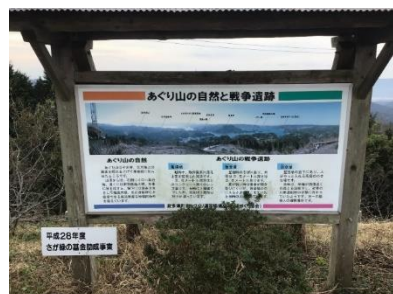
伊万里編③ アグリ山航空監視廠跡