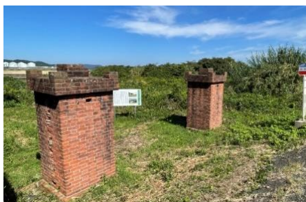
伊万里編② 川南工業浦ノ崎造船所跡