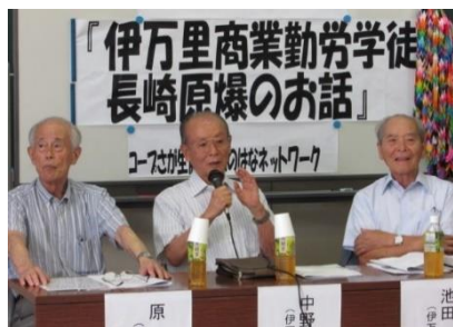
伊万里編① 伊万里商業学校学徒動員 長崎原爆の被爆

戦後76年、戦争を知らない世代が増加し、一方では、戦争を体験した世代の高齢化が進み、減少しています。 組合員の「戦争体験者の生の声を映像で残したい、戦争の記憶を風化させず後世に語り継いでいく」という思いで、実行委員会による佐賀の戦跡を動画に収める活動に取り組んでいます。