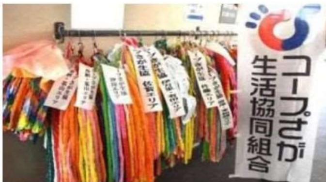
昨年、長崎原爆資料館へ寄贈した約4万4千羽の折り鶴