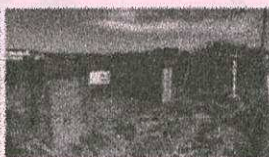
伊万里編② 川南工業港ノ崎造船所跡