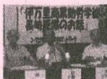
伊万里編① 伊万里商業学校生徒動員 長崎原爆の被爆