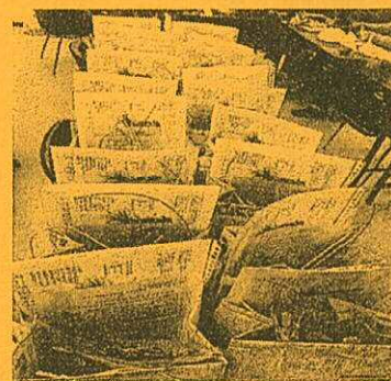
新聞紙で作った手作りバッグ