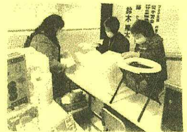
＜防災グッズも展示＞