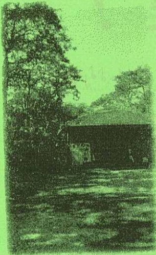
木々に囲まれたすぎの子文庫

「子どもたちは本を読むだけではなく、 外で元気に遊び秘密基地もいくつかあるんですよ」と スタッフの方が話されていました。 沢山の木々に囲まれているせいか、車の音もあまりせず 水の流れる音や鳥の鳴き声、風に揺れる木々の音に とても癒される空間でした。