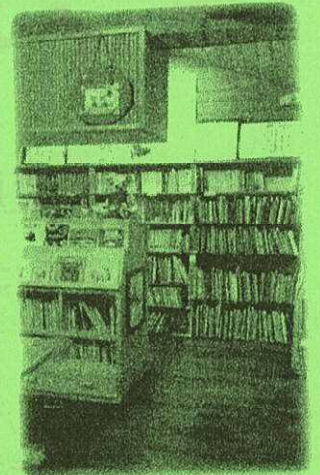
壁いっぱいいろいろな本が 並んでいます