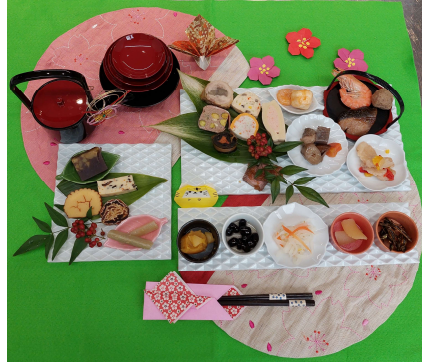
お皿にうつして1人前