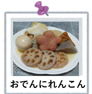
おでんにれんこん