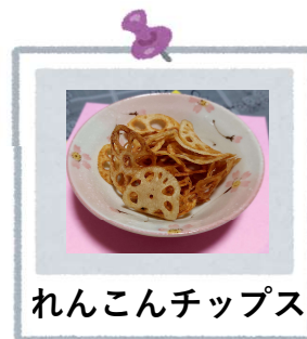
れんこんチップス