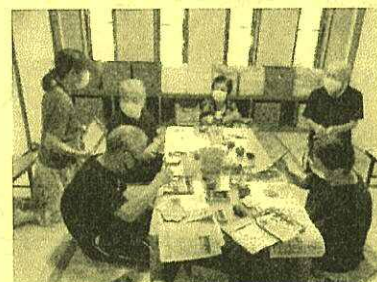
えんJOYねっと取材の様子

人と話すのが好きな方、イベント企画が好きな方、地域の活動に興味がある方等、大歓迎!!