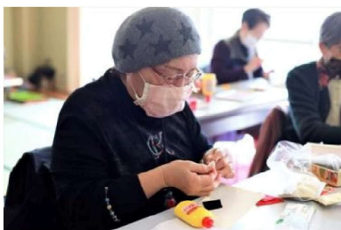
つまみ細工出来上がり

オレンジカフェは5年前より、そんな認知症予防の目的で地域の高齢者を対象に、様々な活動を実施して楽しい時間を過ごされています。