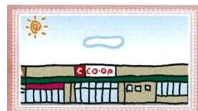
＜コープさが新栄店＞