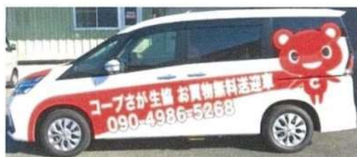
＜お買い物無料送迎車＞