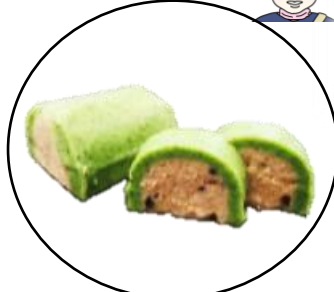
ほうれん草とミートのパテ