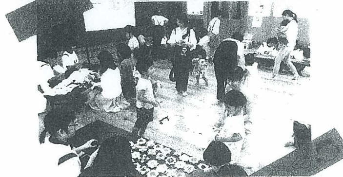
←左 若楠にこにこ子育てサークル (若楠) 「夏祭り」