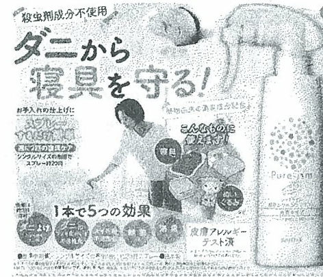
*パレット7月号の第2週目に載ります