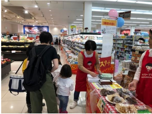
クイズ用紙をもらって 受付スタート