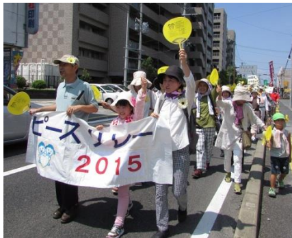
昨年のピースリレー

☆歩く距離は約1.6km、お子様も参加しやすいコースです 参加無料 ご家族いっしょにご参加ください。