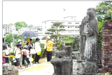
「生協平和のまち歩き」 平和が仆の案内で浦上天主堂を見学(2011年)

16:10頃 長崎発→ 17:40頃 北方着→ 18:20頃 佐賀着 → 18:40頃 神崎着→ 19:10頃 鳥栖着