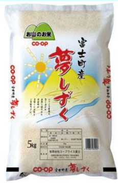
富士町産 夢しずく