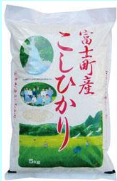
富士町産 杉山こしひかり