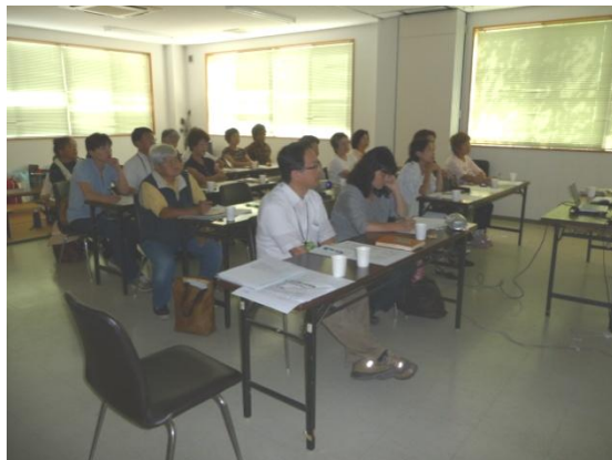
9月10日 第一支所では22名の参加