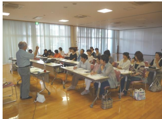
9月12日 三日月ゆめりあでは28名の参加

6月の通常総代会で、組合員より、玄海原発への対応や、原発による放射線についての学習の要望が出されました。各エリア委員会の希望で9月10日第一支所、9月12日三日月町ゆめりあにて学習会を開催しました。10月17日にも第四支所にて開催予定です。